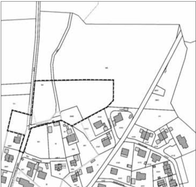
Abbildung 1: Lageplan des Geltungsbereiches des gegenständlichen Bebauungsplanes, unmaßstäblich

Der Marktgemeinderat des Markt Kaltental hat in öffentlicher Sitzung am 01.10.2024 die Aufstellung des Bebauungsplanes „Wohngebiet Aufkirch – Nord II“ beschlossen und in öffentlicher Sitzung am 30.06.2025 den Entwurf, bestehend aus Planzeichnung, Satzung und Begründung mit Umweltbericht, gebilligt und beschlossen, diesen nach § 3 Abs. 2 BauGB über den regulären Zeitraum zu veröffentlichen. Der Geltungsbereich des Plangebietes liegt am nördlichen Rand des zum Markt Kaltental gehörenden Ortsteil Aufkirch, südwestlich des Ortsteils Altensberg und nördlich des Nelkenwegs und des Narzissenwegs. Das Plangebiet beinhaltet die Grundfläche bzw. Teilflächen (TF) der Grundstücke mit den Fl. Nrn. 385 (TF), 394, 395, 396 (TF), 396/6 und 391/3, Gemarkung Aufkirch. Der Planung sind externe Flächen und Maßnahmen zum Ausgleich zugeordnet. Diese liegen ca. 2 km südlich des Geltungsbereiches auf der Fl. Nr. 1570, Gemarkung Aufkirch, auf Teilflächen von ca. 0,33 ha. Das Plangebiet weist eine Größe von ca. 1,12 ha auf. Im Einzelnen gilt der Lageplan vom 23.06.2025. Der Lageplan ist im folgenden Kartenausschnitt dargestellt :