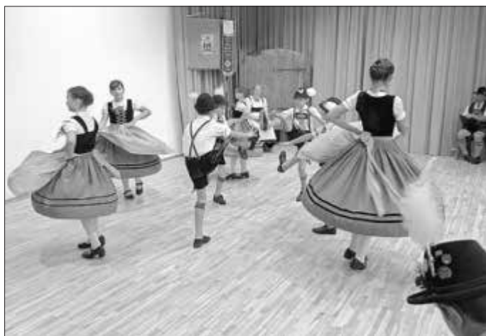
Die Jugendgruppe bei Ihrem Auftritt.

Insgesamt ein toller Erfolg für die Gennachtaler Jugend!